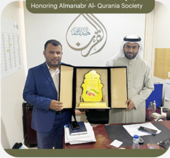
تكریم جمعية منابر القرآنية Honoring Almanabr Al- Qurania Society